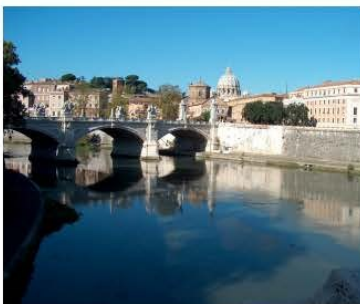
Tiber mit St. Peter